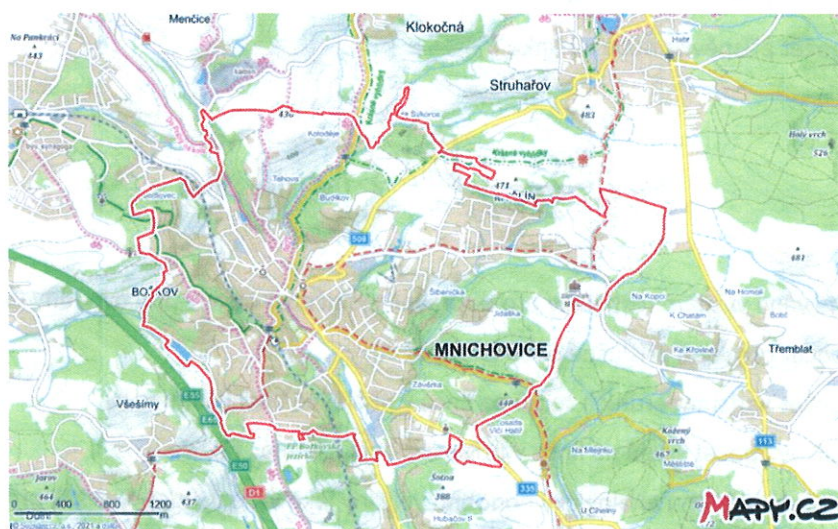
Mapa města Mnichovice, zdroj: Mapy.cz, 2021.

Město Mnichovice a jeho 3 950 obyvatel obsluhují 3 autobusové (489, 490 a 495) a 2 železniční linky (S9 a R49). Město má 3 místní části: Božkov (cca 700 obyvatel), Mnichovice (cca 3000 obyvatel) a Myšlín (cca 250 obyvatel). Váha významnosti linek je nejprve rozdělena podle počtu obyvatel v místních částech: Božkov 0,18; Mnichovice 0,76 a Myšlín 0,06.