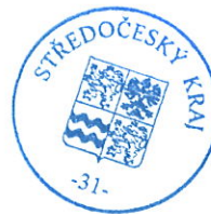
..... razítko Středočeského kraje