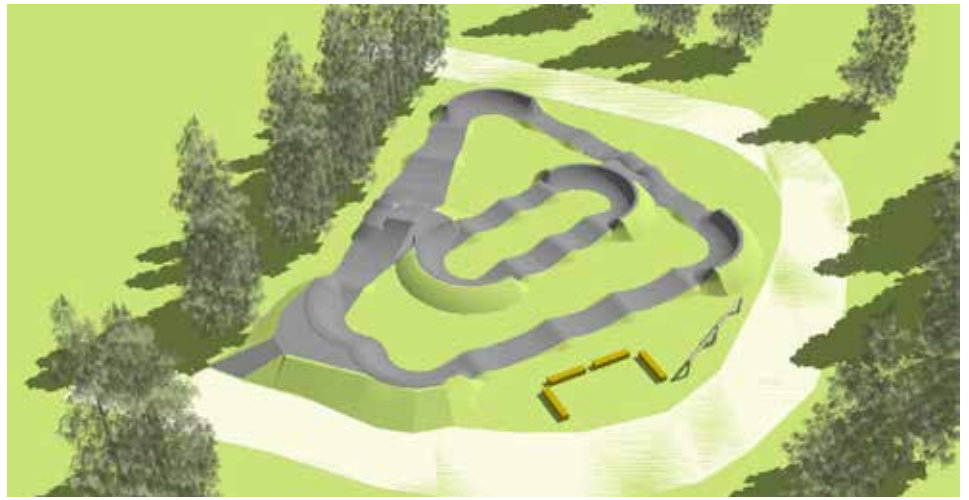
Vizualizace pumptrackového hřiště ve sportovním areálu obce v Lesní ulici.