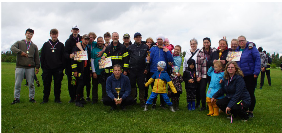
Účastníci Podlipanské hasičské ligy, rodiče a trenéři.