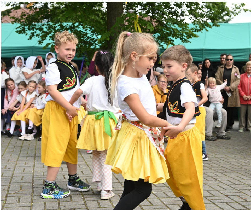
Děti z Mateřské školy v Lánech při vystoupení na lánské návsi.