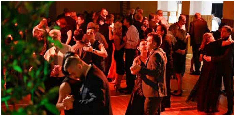
Taneční páry nevynechaly jedinou melodii kapely Gurmania Band.

Tradice se mají dodržovat, a proto každoročně na Lánech zahajujeme plesovou sezónu Reprezentačním plesem obce Lány a Muzea T. G. Masaryka v Lánech. Letošní 17. ročník se konal v sobotu 25. ledna a lánská sokolovna byla opět zaplněna do posledního místa.