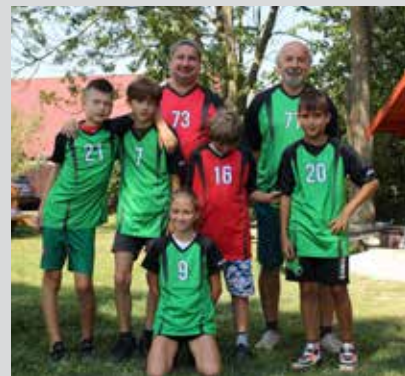
Náš Vašírov – junioři po zápase 25. 8. 2024

Při zimní sportovní přestávce se nám za přispění obce Lány podařilo zrekonstruovat část sportovního areálu v naší obci, a aby tento areál nezahálel, rozhodli jsme se v letošním roce navázat na předcovidové dění i ve sportovní oblasti a vzkřísit naše volejbalové ambice. Za příznivého počasí jsme začali trénovat již v průběhu měsíce března. Turnaje jsme odehráli v květnu a v červnu a 25. srpna jsme se sešli na XXII. turnaji v „úsměvném volejbalu“.