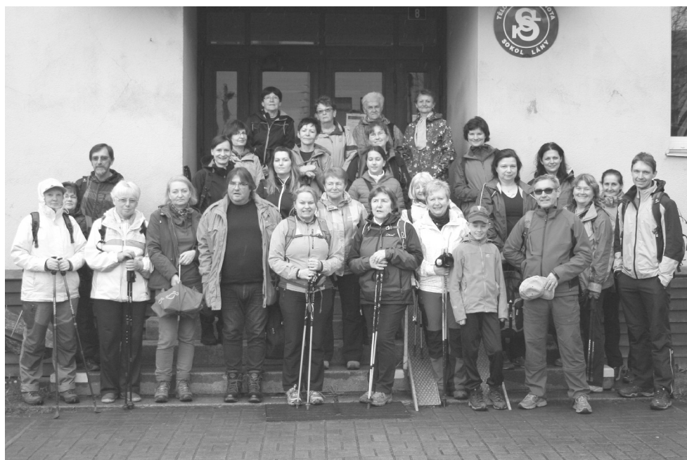
Na třicet účastníků se sešlo v neděli 17. dubna u sokolovny a autobusem vyrazili do Sv. Jana pod Skalou. Tam za pěkného počasí absolvovali výšlap asi 15 km.