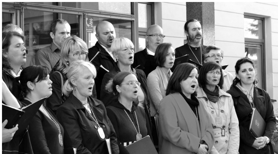
Lánský pěvecký sbor Chorus Laneum