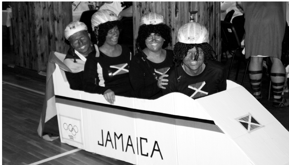
Vítězná maska - jamajský čtyřbob - přijela z ulice Pod Hřištěm