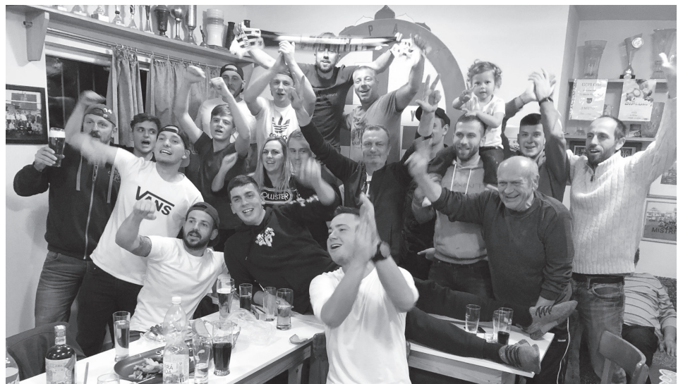
Lánští fotbalisté slaví 4. místo v tabulce po podzimní části sezóny 2021/2022.