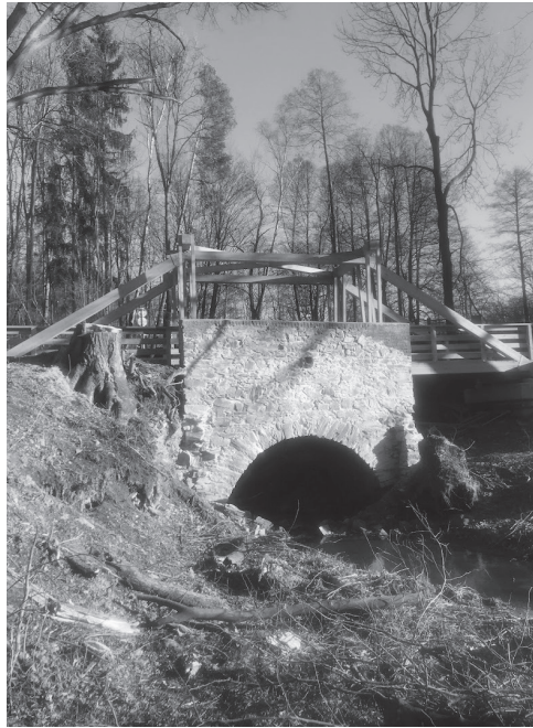
Nová lávka přes Klíčavský potok a oborní brána