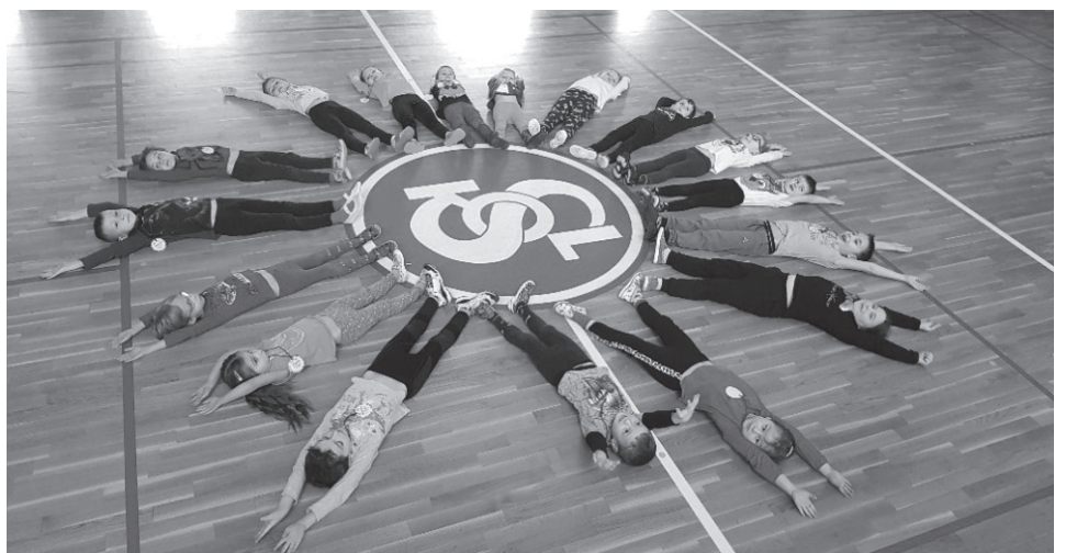
Děti z MŠ Lány během projektu Se Sokolem do života aneb Svět nekončí za vratky, cvičíme se zvířátky.