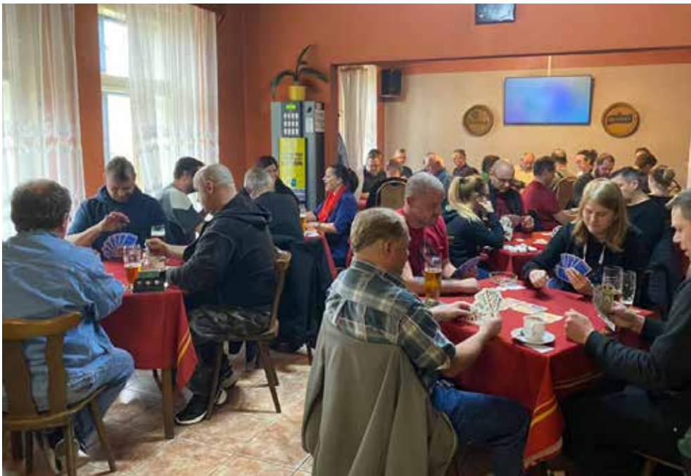
Křivoklátská restaurace zaplněná hráči 13. ročníku Lány Lóra Cup.

Dne 9. prosince 2023 se uskutečnil již 13. ročník turnaje v karetní hře Lóra. Ten se jako v minulých ročnících odehrál v restauraci Křivoklátská pod tradičním názvem Lány Lóra Cup.