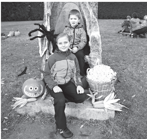
Strašidelná výzdoba na návsi

Řada dalších návštěvníků třeba jen přišla okouknout, co se děje, a dát si nějakou dobrotu. A že byl výběr bohatý. Vynikající uzené kachní prso na dýňové kaši z Restaurace Narpa, skvělé vafle nebo palačinky od dětí z PALAČINKÁRNY, jejichž příprava má pro mladé cukráře i výchovný efekt. No a kluci z JAPETO se svojí výbornou voňavou čerstvou pizzou a českými pomfritkami, kterým říkají tetínské, a všichni jsme viděli, jak je krájejí těsně před smažením, o těch nemusíme ani mluvit. Takové poctivé domácí hranolky si pamatují naposledy jako dítě. A jak dopadla Stezka odvahy pro děti? Zaskočilo nás, kolik účastníků přišlo. Museli jsme dotisknout pár kartiček (takzvaných Vandrov-