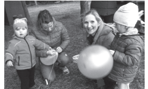
Balónky se vzkazem připraveny k vypuštění.