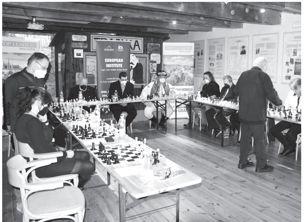
Simultánní partie se odehrála v 1. patře bývalé fürstenberské sýpky, dnes Muzea T. G. M. v Lánech