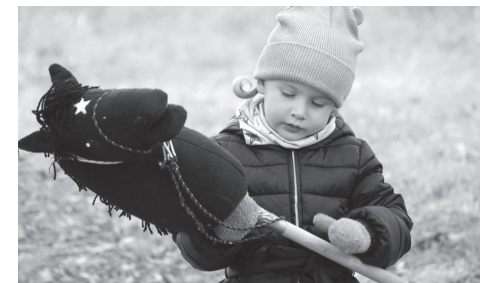
Nejmladší účastnice závodu

Hobby Horsing je sport, při kterém jezdci napodobují klus, cval a celkově pohyb skutečného koně. Závodníci mají s sebou své horsíky (často i vlastnoručně vytvořené koňské kamarády). Závod měl tři části: parkur, drezuru a volnou jízdu. Každá disciplína byla hodnocena zvlášť, úspěšně