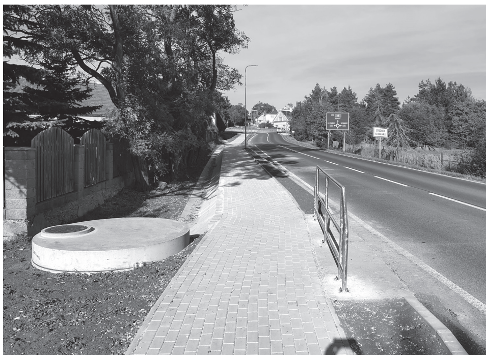
Dokončený chodník od kruhového objezdu na Slovance už chodci využívají.