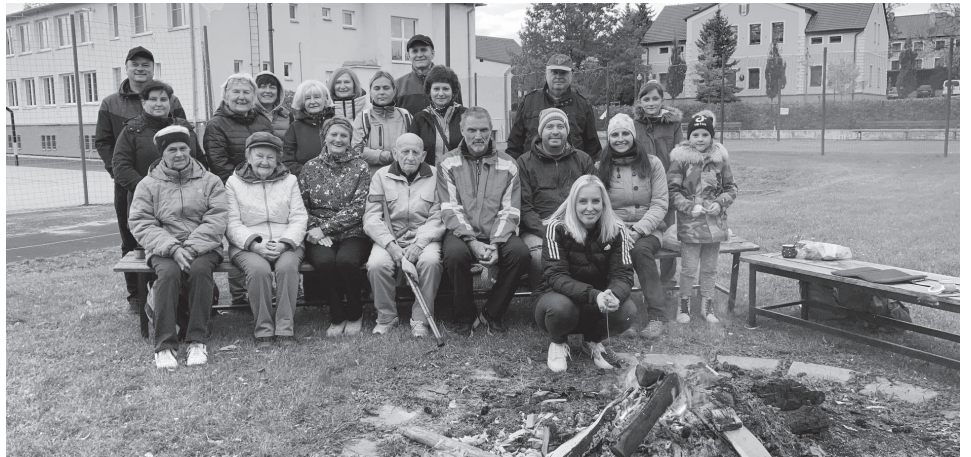
Rozlučková fotografie účastníků desátého ročníku u ohně za lánskou sokolovnou

V sobotu 24. října 2021 byl ukončen desátý ročník soutěže PÉTANQUE v Lánech. Přes nepříznivé okolnosti související s COVIDEM byl opět úspěšný. Účast byla rekordní, pétanque se řadí k nejmasověji provozovaným společensko-sportovním aktivitám v obci.