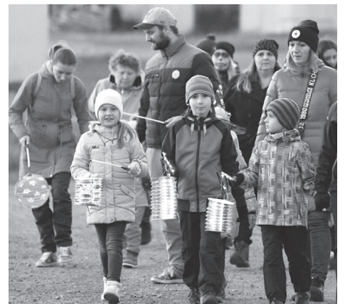
Děti v areálu školního statku

Bohužel, předpověď počasí nám moc nepřála. Na čas průvodu byl hlášený nejsilnější vítr za celý den. Rozhodli jsme se proto z bezpečnostních důvodů odpálit ohňostroj z Kopaniny. Obvykle tahle barevná atrakce startuje z hladiny rybníka a je to úžasná podívaná. Ale letos jsme si to zkrátka netroufli. Chápeme zklamání někte-