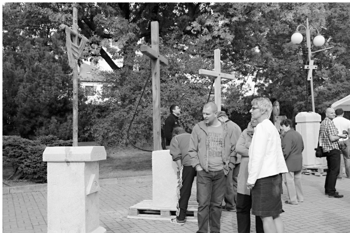
Souboj české šikovnosti a tvrdého kamene se odehrál během třetího Sochařského symposia. Kdo vyhrál? (Masarykovo náměstí v Lánech, 21. - 27. 9. 2015, vernisáž 3. října 2015).