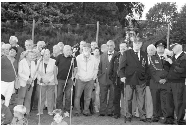
Lány na tatíčka Masaryka nezapomínají (hřiště za sokolovnou v Lánech, 19. 9. 2015). Na akci se podílí: SDH T. G. M. Lány, Muzeum T. G. Masaryka Lány, TJ Sokol Lány.