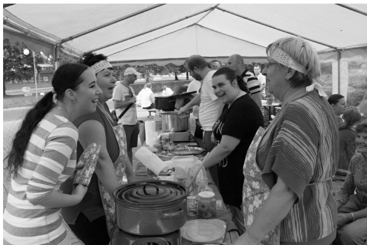
Lánsťáci mají rádi dobré jídlo, což teprve kvalitní guláš v několika verzích! (Masarykovo náměstí v Lánech, 22. 8. 2015). Na akci se podílí: Hospoda Narpa, TJ Sokol Lány.