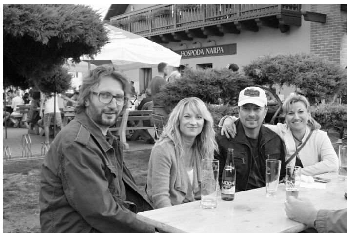
Vůně, zabijačkové dobroty, dobrá muzika, sousedské tlachání. Co víc si přát? (Masarykovo náměstí v Lánech, 19. 9. 2015). Na akci se podílí: SDH T. G. M. Lány, Hospoda Narpa, Baráčníci, TJ Sokol Lány.