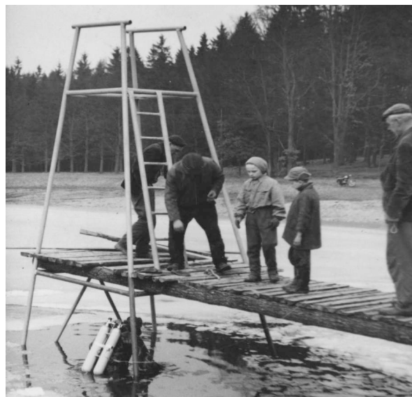
Stavba koupaliště Pánovka v letech 1958-1965